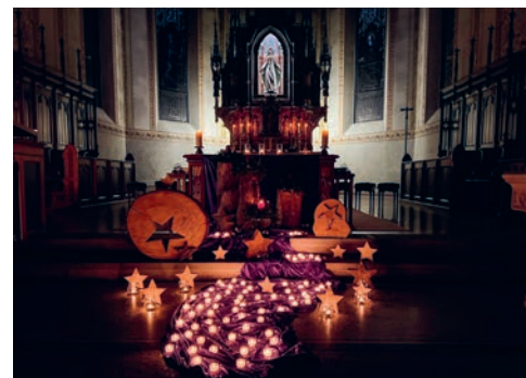
Rorate mit der Frauengemeinschaft

Das am 2. Februar begangene, der christlich-katholischen Tradition entstammende Fest Mariä Lichtmess feiert die Rückkehr des Lichts, das Schutz und Wohlstand symbolisiert. Es erinnert an die Darstellung Jesu im Tempel, der als Licht des Volkes Israel verstanden wird. Im Gottesdienst vom Samstag, 1. Februar, 18.00 Uhr, sind Sie herzlich zum Blasiussegen eingeladen. Ebenfalls dürfen Sie auch Ihre Kerzen zum Segnen mitbringen.