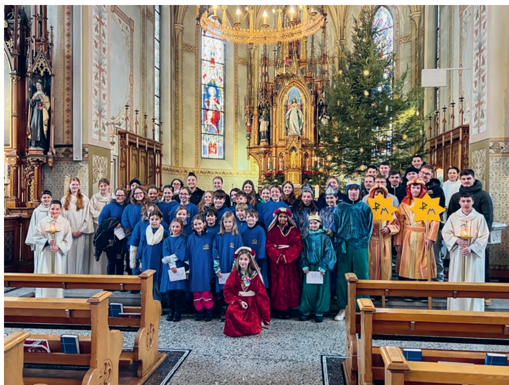
Eine grosse Schar Blauringmädchen und Jungwachtbuben freuten sich auf das Sternsingen. Sie durften den schönen Betrag von Fr. 2615.30 sammeln.

Die Jubla Bazenheid hat wieder einen tollen Spieleparcours aufgebaut, welcher von den jungen und jung gebliebenen Fasnächtlern absolviert werden kann. Für das leibliche Wohl sorgt die Festwirtschaft und für lustige Schnappschüsse die Fotobox. Eine Superstimmung garantieren die Jubla Bazenheid, der DJ, die Bazenheider Guggewöger und die Interessengemeinschaft Kinderfasnacht.