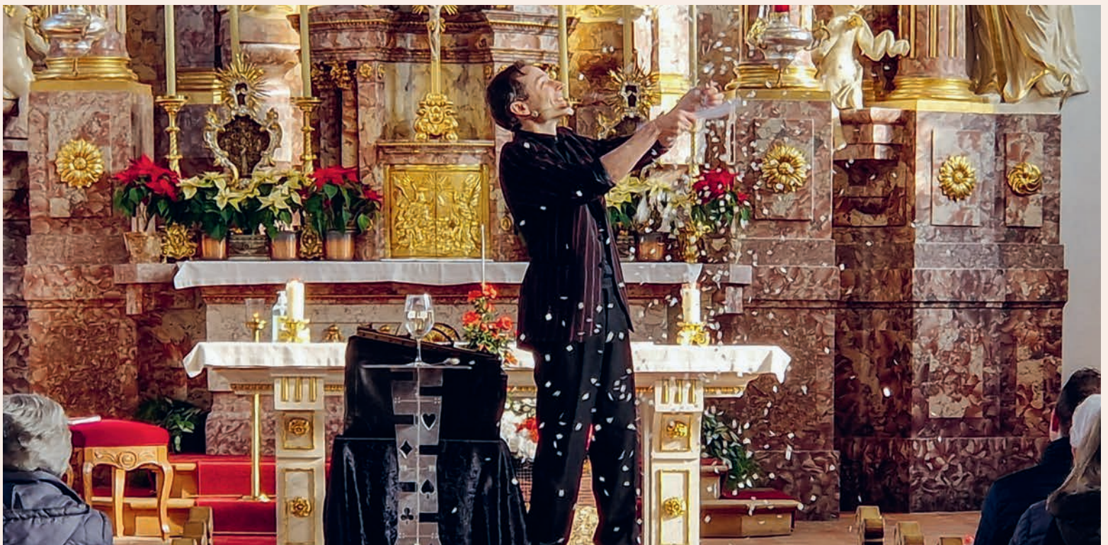
Magische Momente beim Gottesdienst für die Seelsorgeeinheit am 9. Februar in Kirchberg.