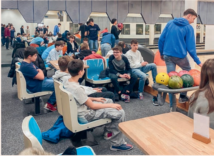
Jugendliche trafen sich im Januar zum Bowlen.