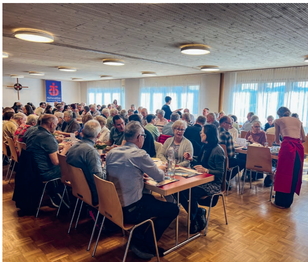
Impressionen vom Suppentag, 9. März.

www.fg-bazenheid.ch | Instagram: www.instagram.com/fg_bazenheid