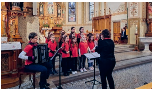
Impressionen der Eucharistiefeier mit den Baze-Spatzä, 23. Februar.