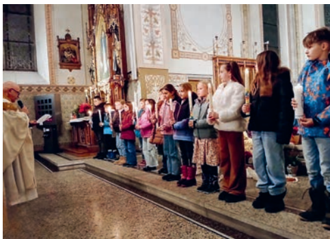
Impression vom Intensivnachmittag der Erstkommunionkinder.

Um 19.30 Uhr in der Pfarrkirche Bazenheid.