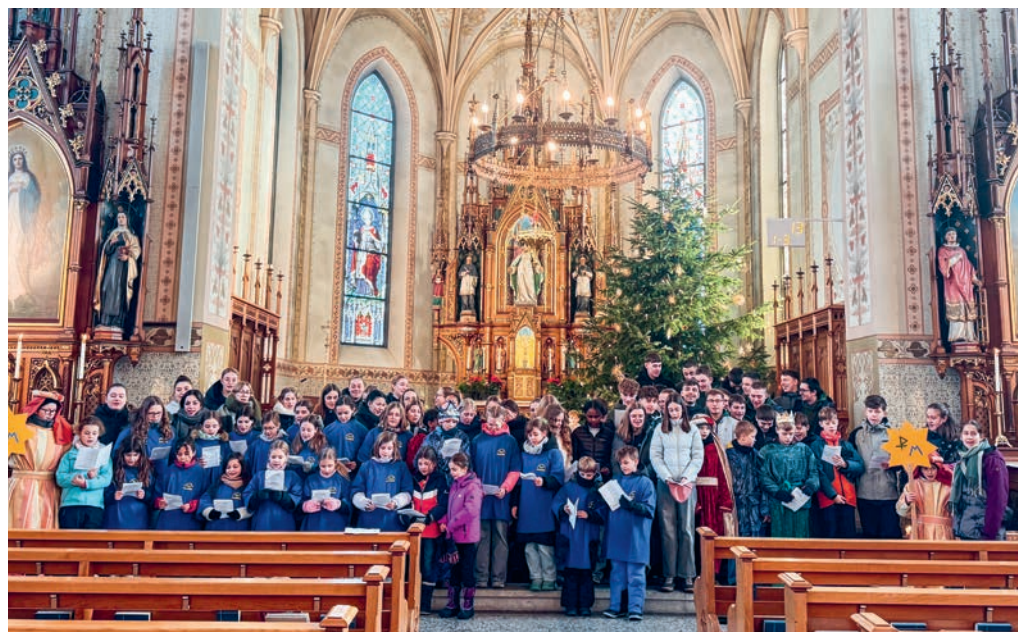
Viele Mädchen und Buben der Jubla starteten mit der Aussendungsfeier zum Sternsingen. Sie durften den schönen Betrag von Fr. 2535.45 sammeln.