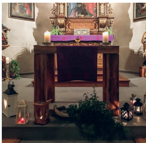
Ölbergwache Kapelle St. Laurentius

Wir begehen diesen grossen Festtag mit einer Messe in der Pfarrkirche Bazenheid um 19.00 Uhr mit anschliessender Ölberg- wache in der Kapelle St. Laurentius, von 20.00 bis 21.00 Uhr (bitte nehmen Sie eine Laterne mit).