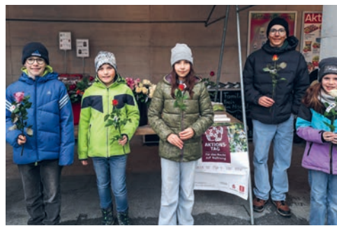
Impression vom Rosenverkauf 14. März

Zur gemeinsamen Maiandacht mit den Seniorinnen und Senioren von Gähwil treffen wir uns am Dienstag, 26. Mai, um 14.00 Uhr in der Pfarrkirche Gähwil. Anschliessend gemütliches Beisammensein im Restaurant Rössli.