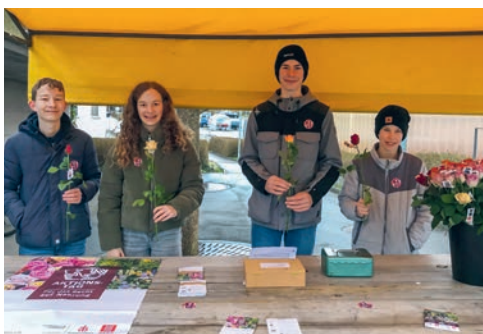
Rosenverkauf 14. März