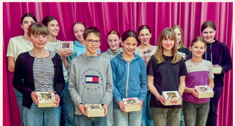
Impression erfolgreicher Pralinekurs

Hast du Lust auf einen entspannten Abend mit gutem Essen und jeder Menge Spass? Dann komm vorbei! Am Samstag, 23. Mai, im Pfarreiheim Kirchberg starten wir mit einem leckeren Spaghetti-Essen und tauchen danach gemeinsam in einen abwechslungsreichen Spielabend ein, von lustig bis spannend ist alles dabei. Bring gute Laune mit und sei bereit für einen Abend voller Lacher, Action und cooler Begegnungen.