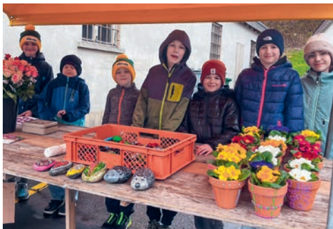
Impression vom Rosenverkauf 14. März

Am Dienstag, 26. Mai, feiern wir um 14.00 Uhr zusammen mit den Senioren von Kirchberg die Maiandacht in der Pfarrkirche Gähwil. Anschliessend gemütliches Zusammensein im Restaurant Rössli.