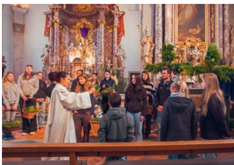
Palmsonntag 29. März