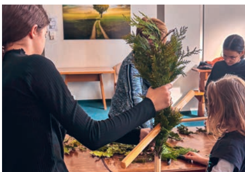
Impression vom Palmsonntag 29. März