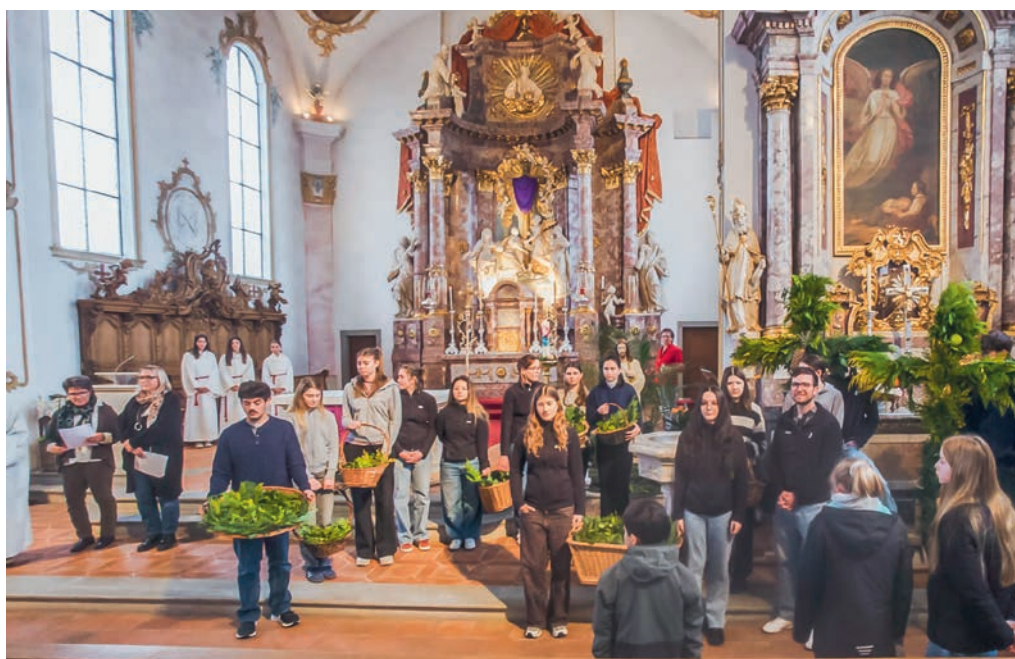
Impression vom Palmsonntag 29. März